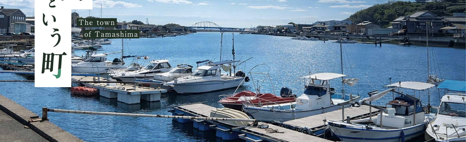
The town of Tamashima

江戸時代に北前船の寄港地として開かれた玉島は、多くの人が集う場となり、茶の湯は「もてなしの心」として息づいていました。その心は今でもこの町に残っています。